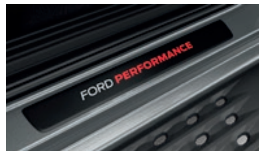
Ốp bậc cửa