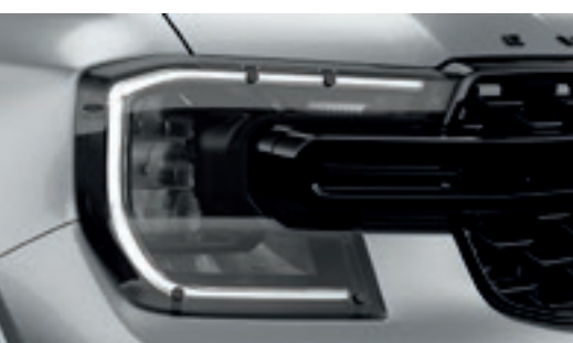
Ốp đèn trước