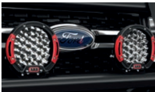
Đèn LED ARB hiệu suất cao