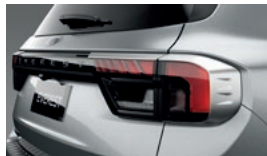
Ốp đèn hậu