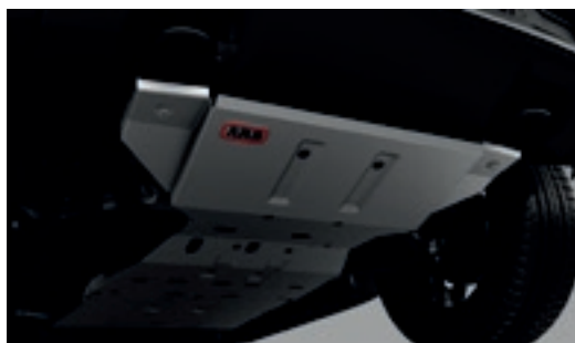
Giáp gầm ARB