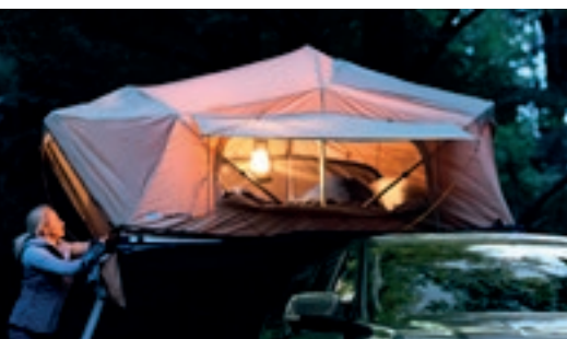
Lều gắn nóc ARB