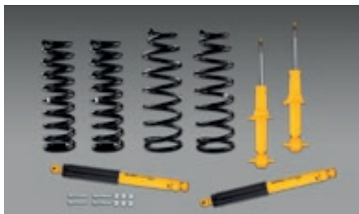
Phuộc sau OME Everest sau 2022