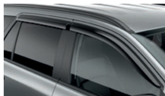
Vè che mưa