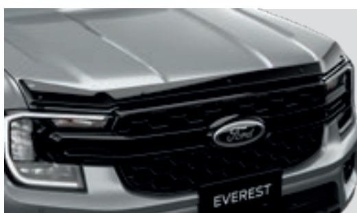
Ốp nắp capo