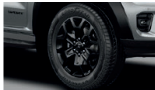
Ốp cua lốp